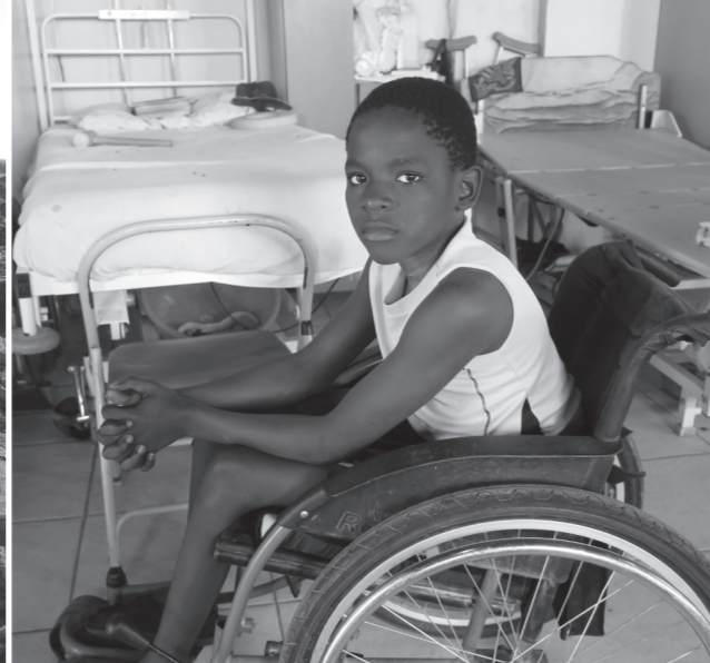
Junger Rehapatient bekommt Hilfe