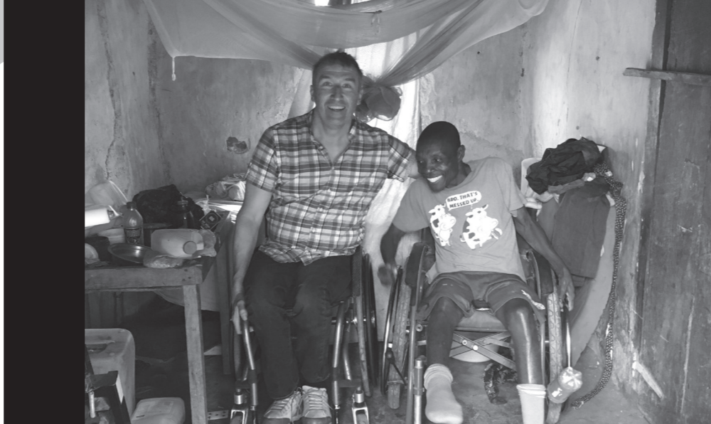
Ehemaliger Rehapatient wohnt auf 8 qm 2