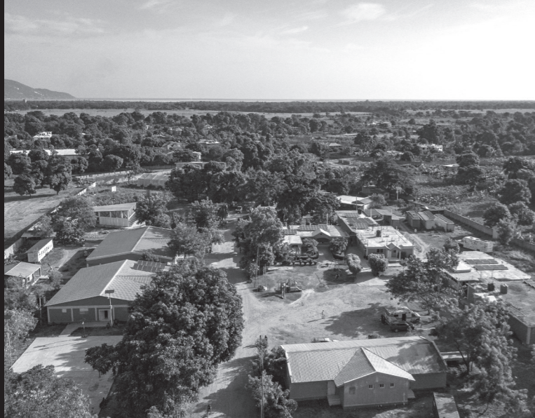
Spitalcampus in Cap Haitien