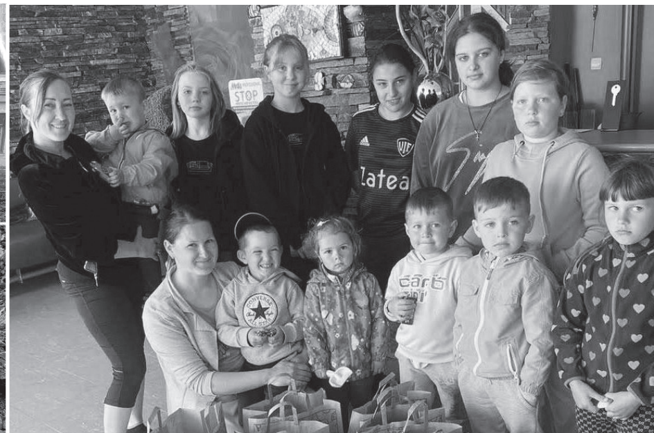
Humanitäre Hilfe für Flüchtlingsfamilien ist nötig.