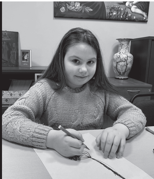
Malen als Therapie macht Freude.