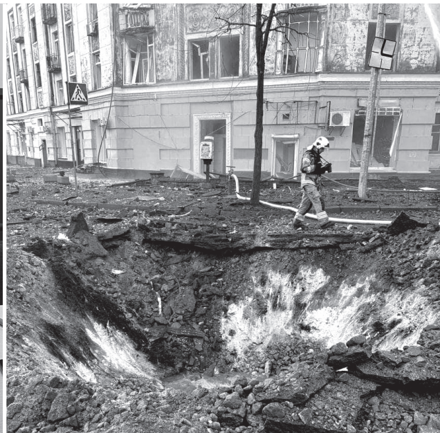
Ständige Luftangriffe gehören zum schrecklichen Alltag.